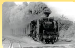
※蒸気機関車(国鉄二俣線時代)

天浜線「天竜二俣駅」には、可動する転車台、扇形車庫が現存しており、全国的にみても貴重な鉄道の歴史遺産となっております。